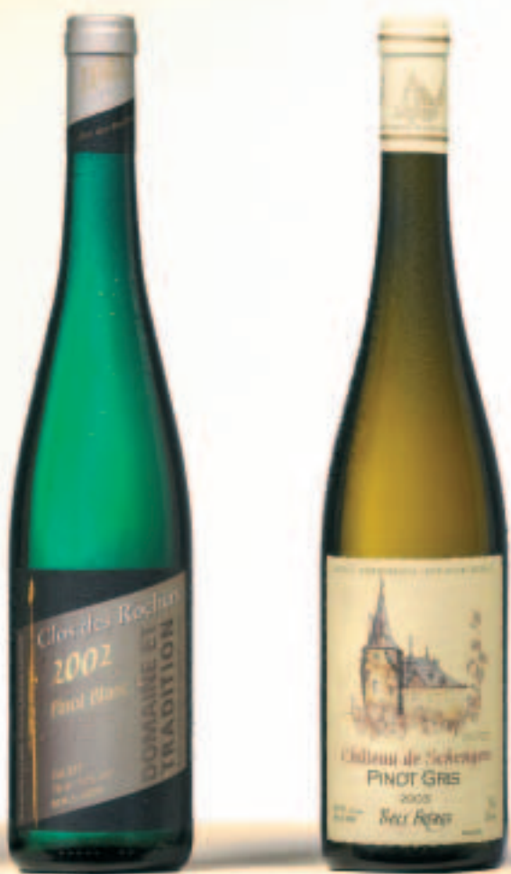
Auxerrois, Côtes de Grevenmacher, Caves Bernard-Massard Riesling, Grevenmacher Fels, Domaine «Clos des Rochers» Pinot Blanc, Domaine et Tradition, Domaine «Clos des Rochers» Pinot Gris, Château de Schengen, Domaine «Thill»